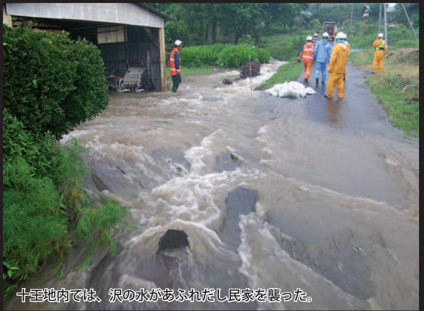
十王地内では、沢の水があふれだし民家を襲った。