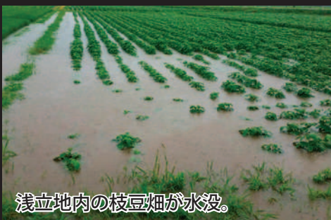
浅立地内の枝豆畑が水没。

7月28日、梅雨前線の停滞の影響を受け、未明から降り続いた大雨により、町内各地で大規模な浸水被害や土砂崩落が発生。 28日午後4時には、黒鴨、針生、細野地区を対象に避難勧告が発令され、自主避難者も含め延べ108名の方々が避難所へ避難しました。 各地区自主防災組織の皆さんと、消防団の皆さんの迅速な対応により、人的被害が1件も発生しなかったことは、不幸中の幸いでした。 今後、復旧が必要な箇所については、早急に対応するとともに、大規模な災害箇所については、災害査定準備などを進めていきます。また、一刻も早い復旧を可能とするために、国や県に支援要請を行い、今後の防災・減災への対応が必要であることについても要望していきます。