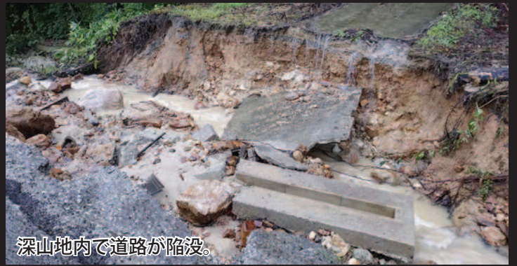
深山地内で道路が陥没。