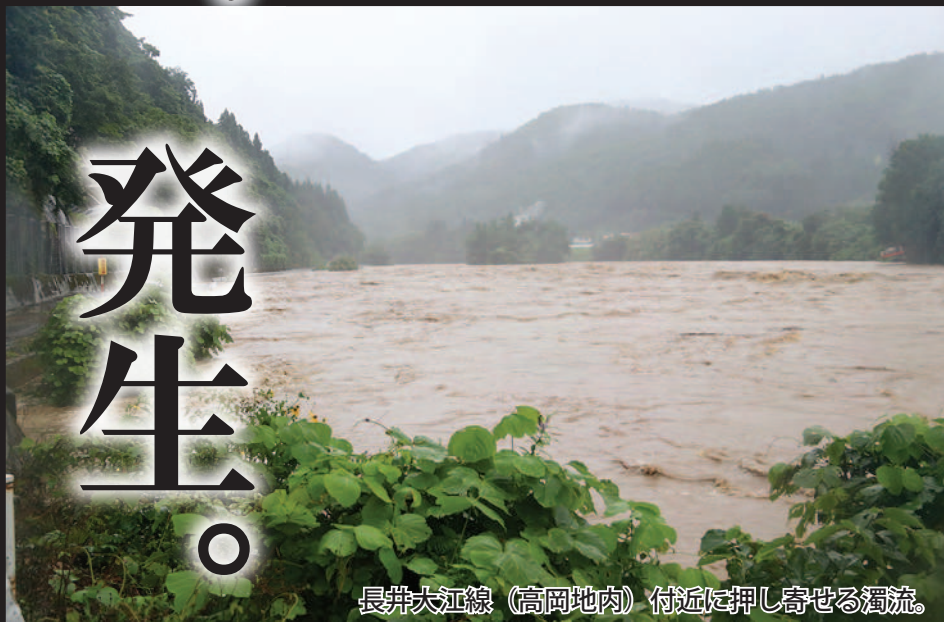
長井大江線（高岡地内）付近に押し寄せる濁流。