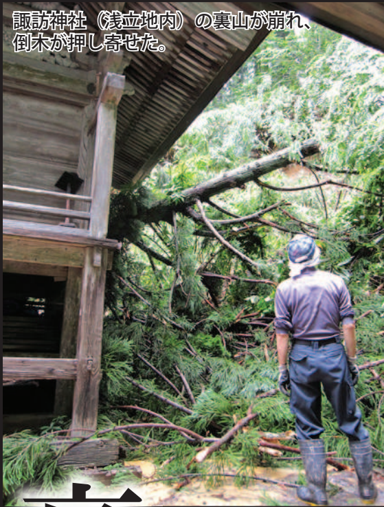
諏訪神社（浅立地内）の裏山が崩れ、倒木が押し寄せた。