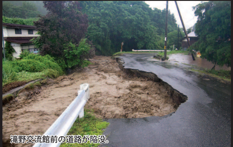
滝野交流館前の道路が陥没。