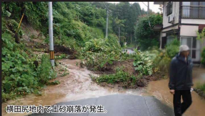
横田尻地内で土砂崩落が発生。