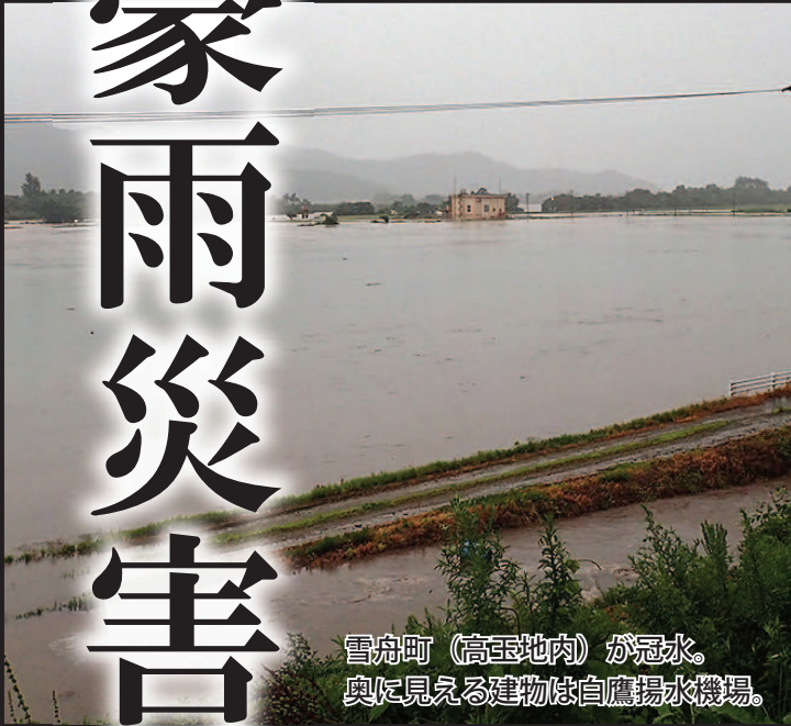
雪舟町（高玉地内）が冠水。奥に見える建物は自鷹揚水機場。