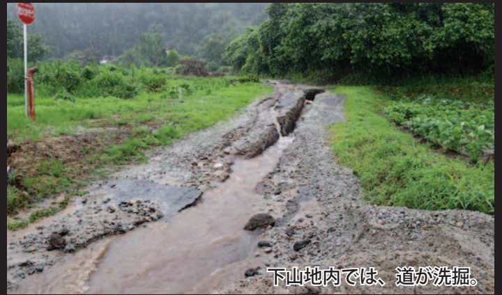
下山地内では、道が洗掘。