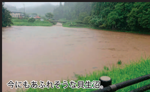
今にもあふれそうな貝生沼。