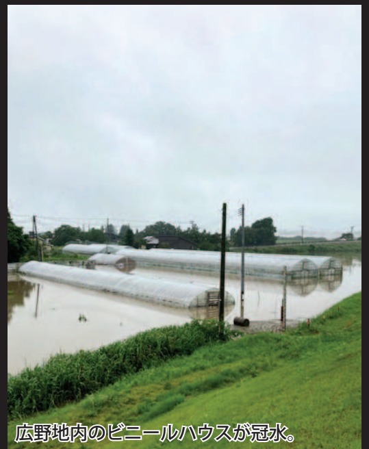
広野地内のビニールハウスが冠水。