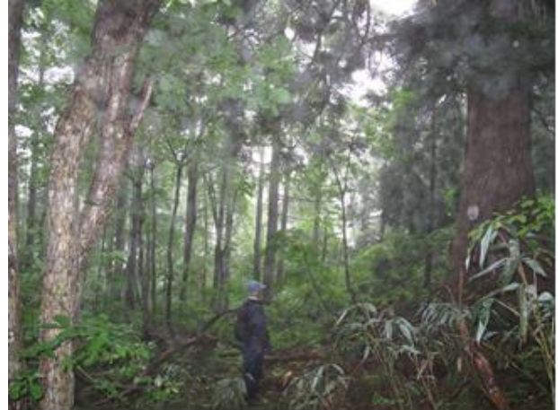
道の傍らには杉の大木が立っている

この日は黒鴨からトラックで茎の峰まで上り、三山の参詣の古道であった山中に入った。ここは私たちが昭和五十四年の秋に、白装束に草鞋がけで歩いているところでもある。それから約三十年あまりの歳月の間に、三山参りの習俗もすたれ、炭焼きや狩猟などで歩く人もなく、萱野の集落もなくなり、やがて廃道と化したのである。