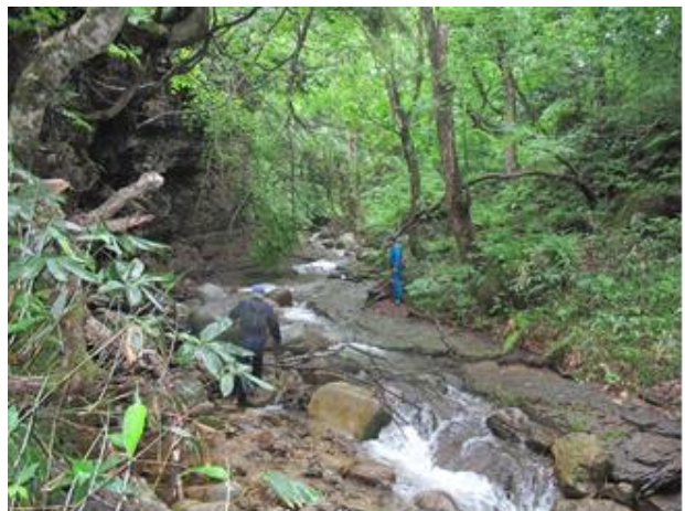
沢を渡って道を探す

ところどころに斜面を切り崩したようなところもあり、杉の切り出した作業道路か、林道を作ったものの途中で放置されたような跡である。いずれにせよ大型の重機が歩いたような道巾で、その跡に新たに雑木や草木が生い茂っていた。こうなると元の道がいったいどこにあるのか、たどるのが実に難儀である。三人とも声を掛け合いながら、やぶの中をしばらくあちこちに歩き回った。