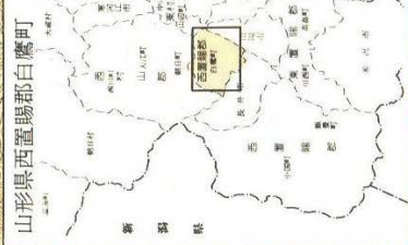
山形県西置賜郡白鷹町